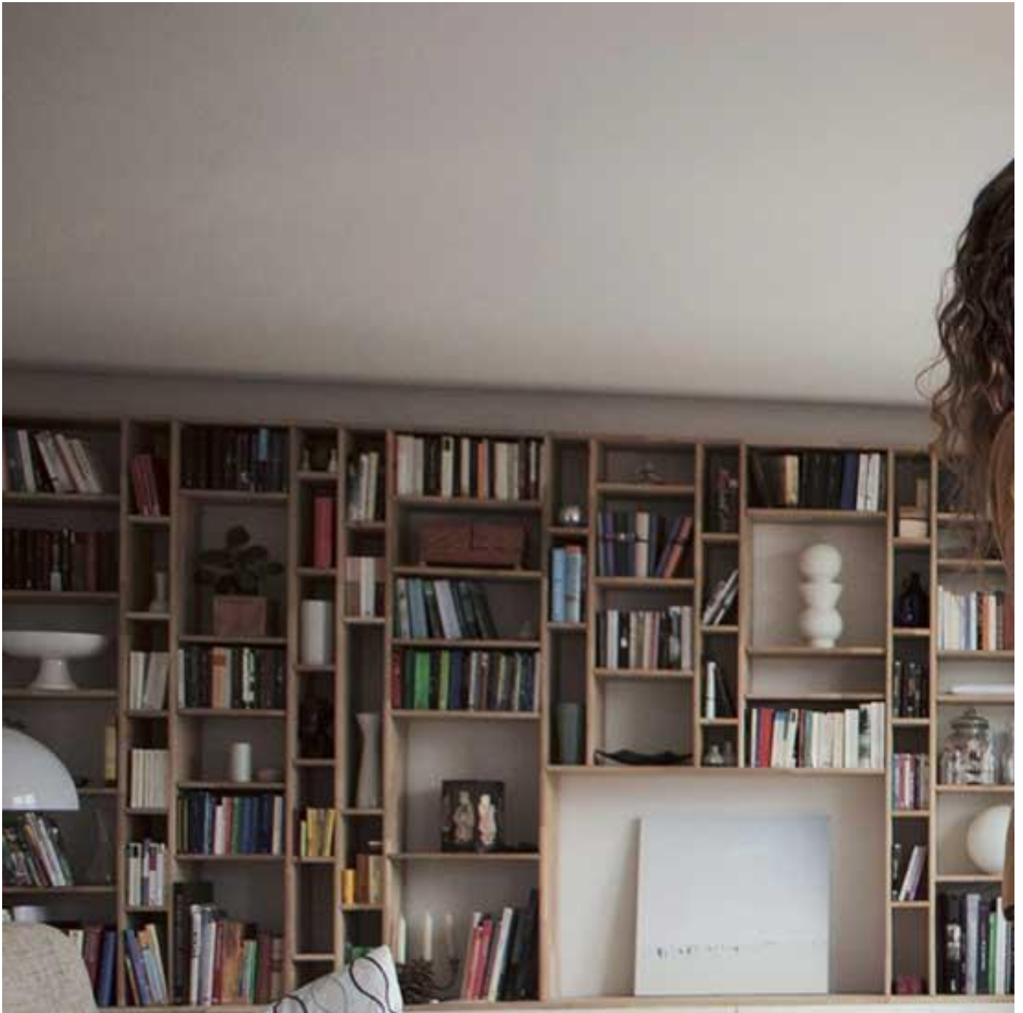
SGG PLANITHERM® ONE