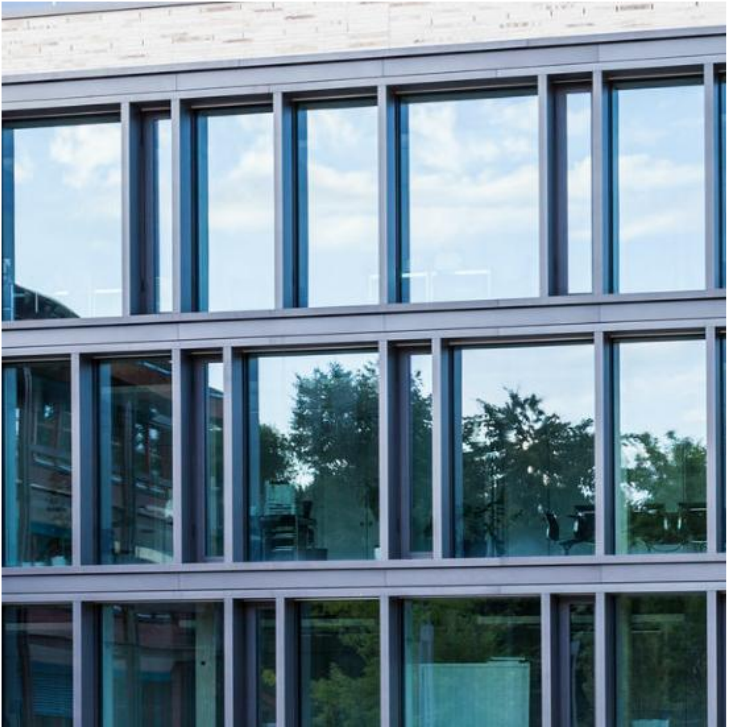
ISOLIERGLAS MIT SONNENSCHUTZ