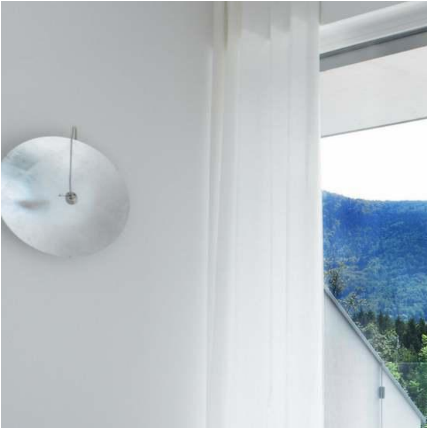
SGG PLANITHERM® XN