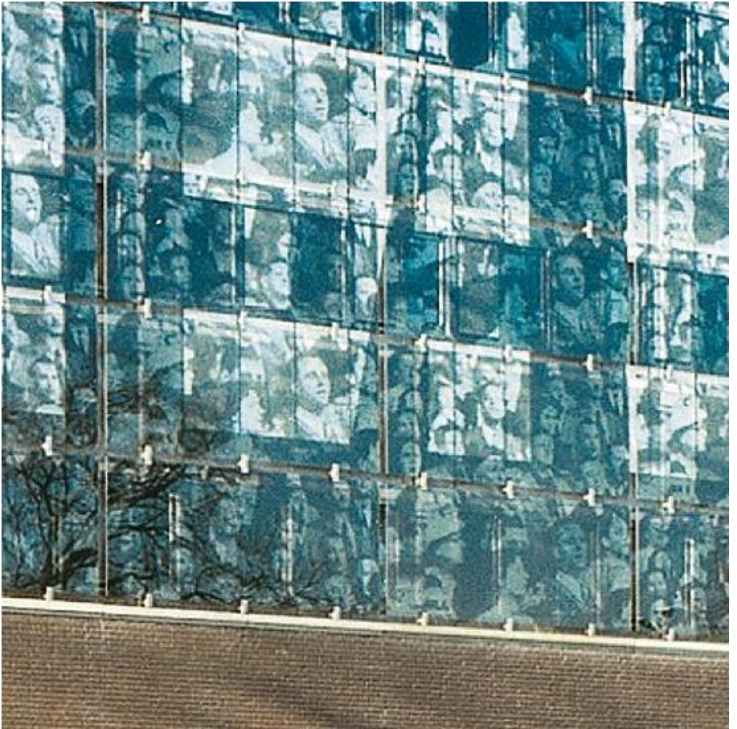
SGG SERALIT® EVOLUTION