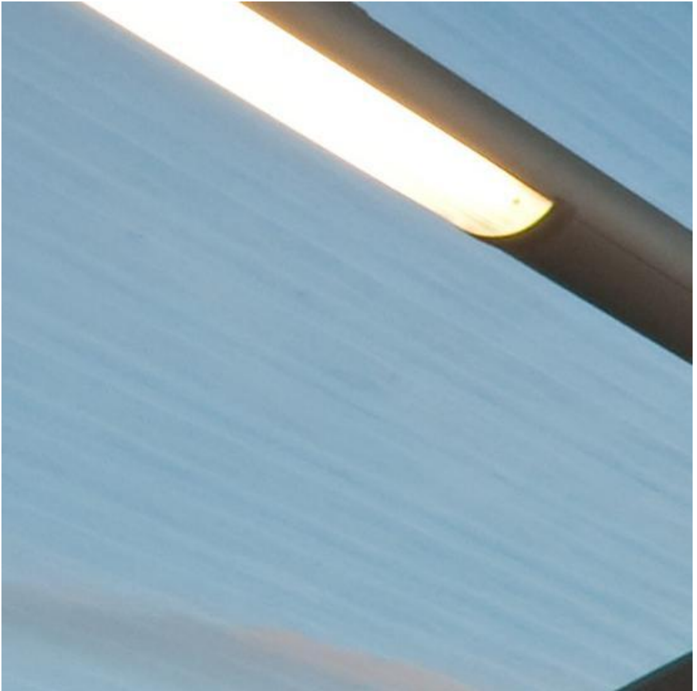
SGG STADIP CONTOUR

In einem stark verglasten Bereich kann es sehr wichtig sein, eine Sonnenschutzverglasung zu nutzen, um Überhitzung und übermäßigen Energieverbrauch für die Klimatisierung zu vermeiden. Daher engagieren wir uns dafür, Ihnen Produkte zu bieten, die Ihren Komfort steigern. Viele unserer Fassadensysteme passen zu SGG COOL-LITE SKN II und XTREME II , den umfassendsten und effizientesten Produktreihen auf dem Markt.