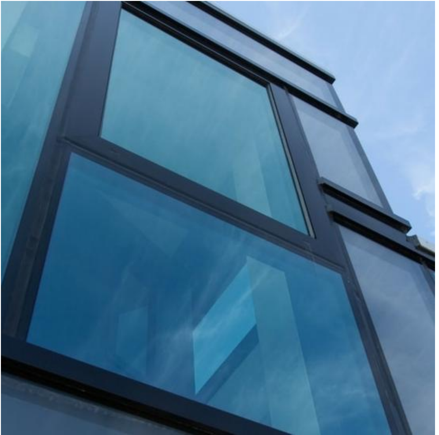
Fassaden und Vorhangfassaden innovative, leistungsfähige Produkte