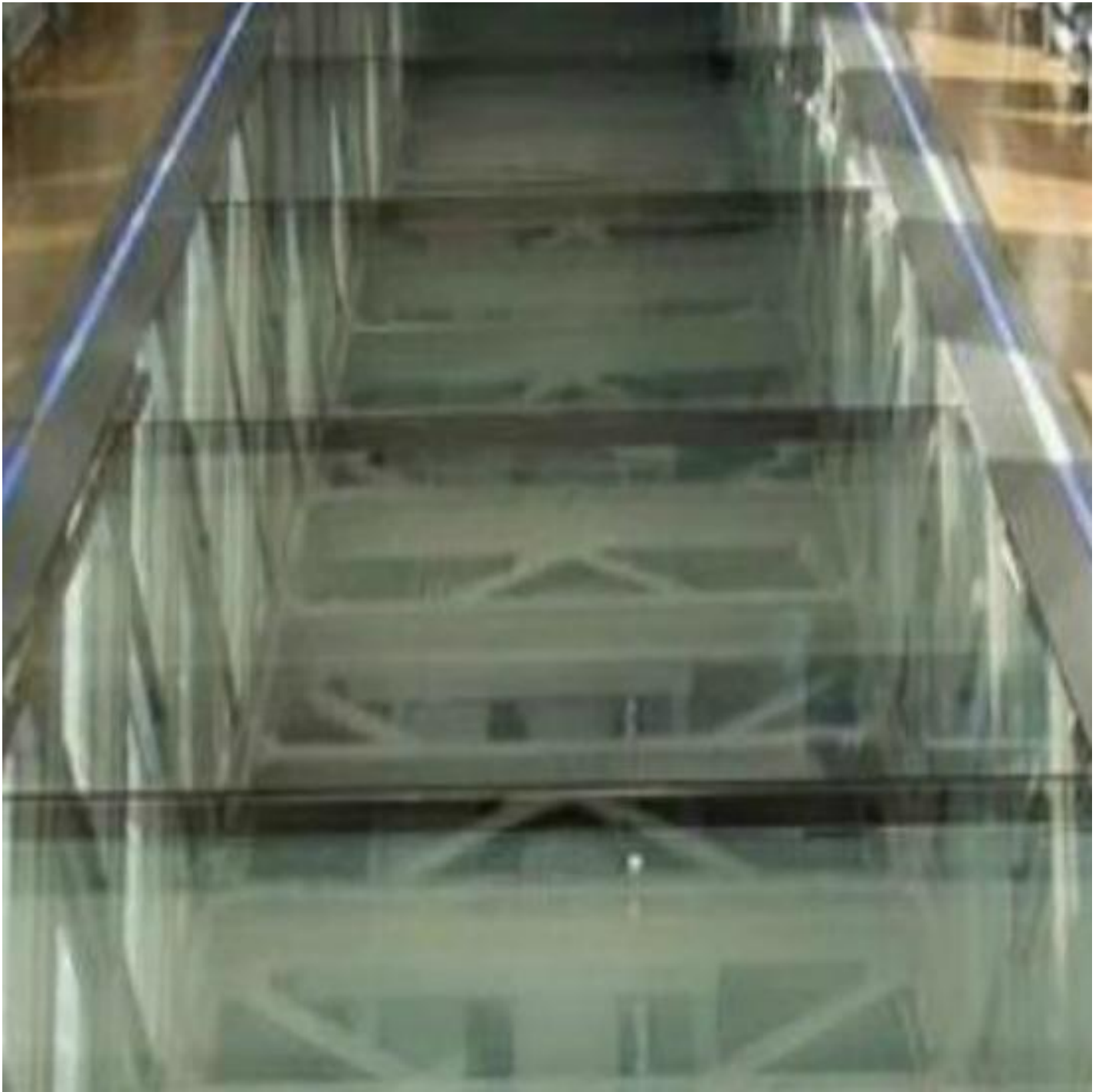
SGG CLIMAPLUS® SAFE / SGG CLIMAPLUS® PROTECT