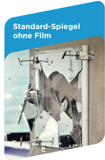
Glasbruchtest – TÜV Rheinland